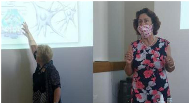
Alzheimer cafe in Štefka Zlobec