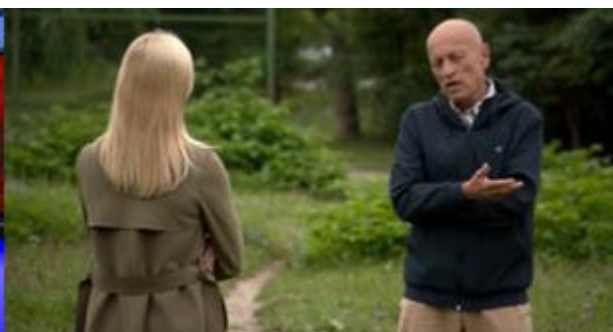
Poročila 24UR (5.8.2020)