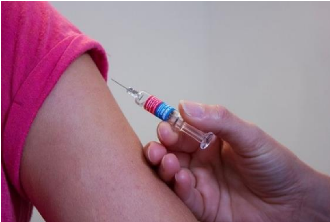
Cepiti se ali ne cepiti?