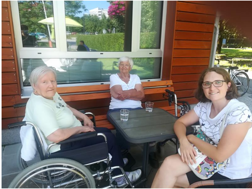
Smeh ima moč.