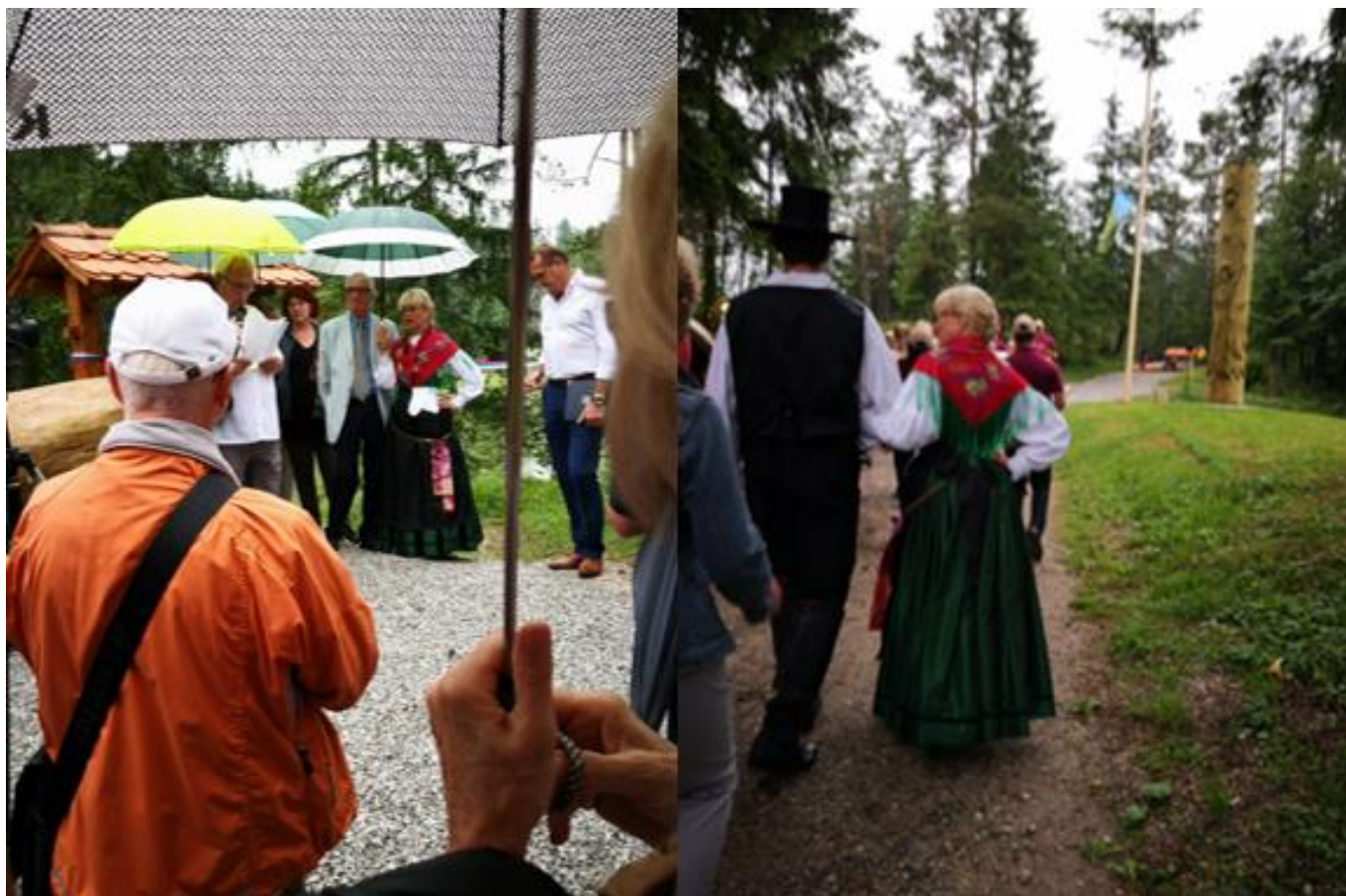
125. obletnica Rakiškega jambora (22.6.2019)