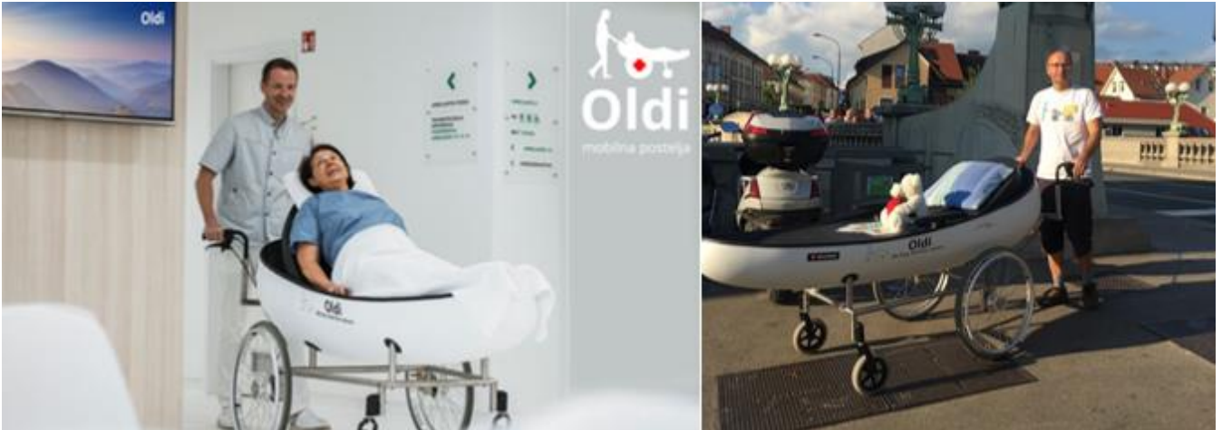
Voziček Oldi nudi lažjo vključenost v družbo in večjo kvaliteto življenja