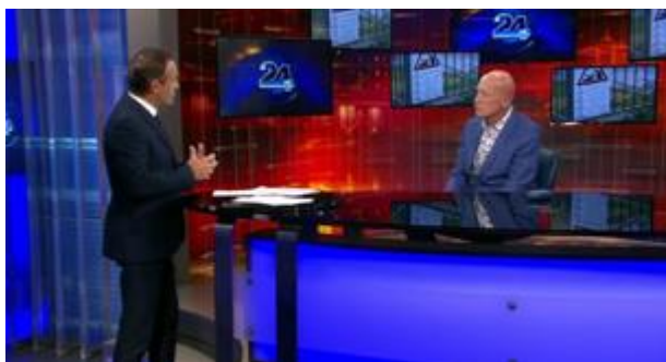
24UR ZVEČER (4.8.2020)