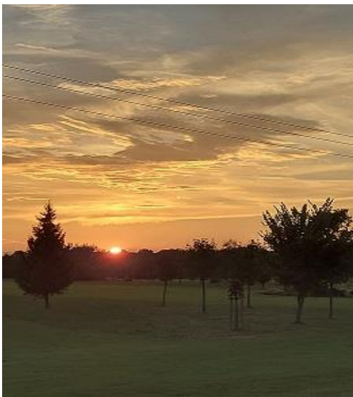
Čudovit sončni zahod

Letošnja obnovitvena rehabilitacija ni potekala po naših pričakovanjih, vsaj kar se tiče druženja in zabave. Poslovali smo se v upanju, da bo prihodnje leto boljše.