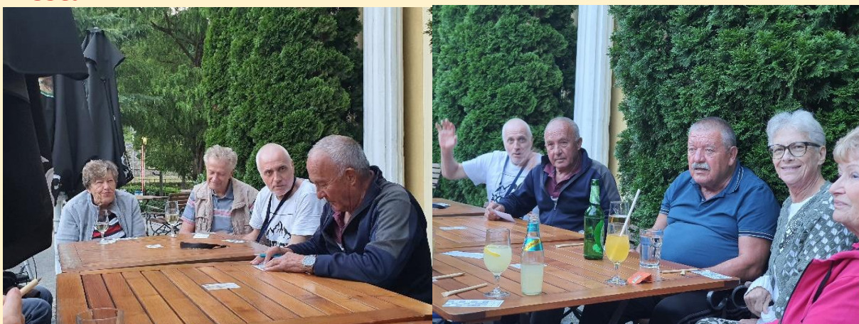
Druženje in tombola na terasi

Letos smo se družili v kavarni in na terasi, če ni bilo deževno ali prevroče. Lažje gibljivi so se podajali na sprehode po parku in mestu.