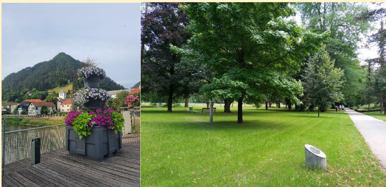
Pogled na Laško in zdraviliški park

Iz gnezd pod Humom so nas pozdravile naše prijateljice čaplje z mladiči, iz Savinje pa tudi labod. Zvečer smo se sestali v Bidermajerjevi dvorani in se pogovorili o vsem, kar nas čaka.